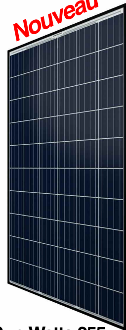
Sun-Watts 255 ALL MAX ULTRA 339,99$

NaviClub Le Supermarché Du Solaire À Québec