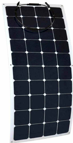
Sun-Watts 100 Semi Flexible G3